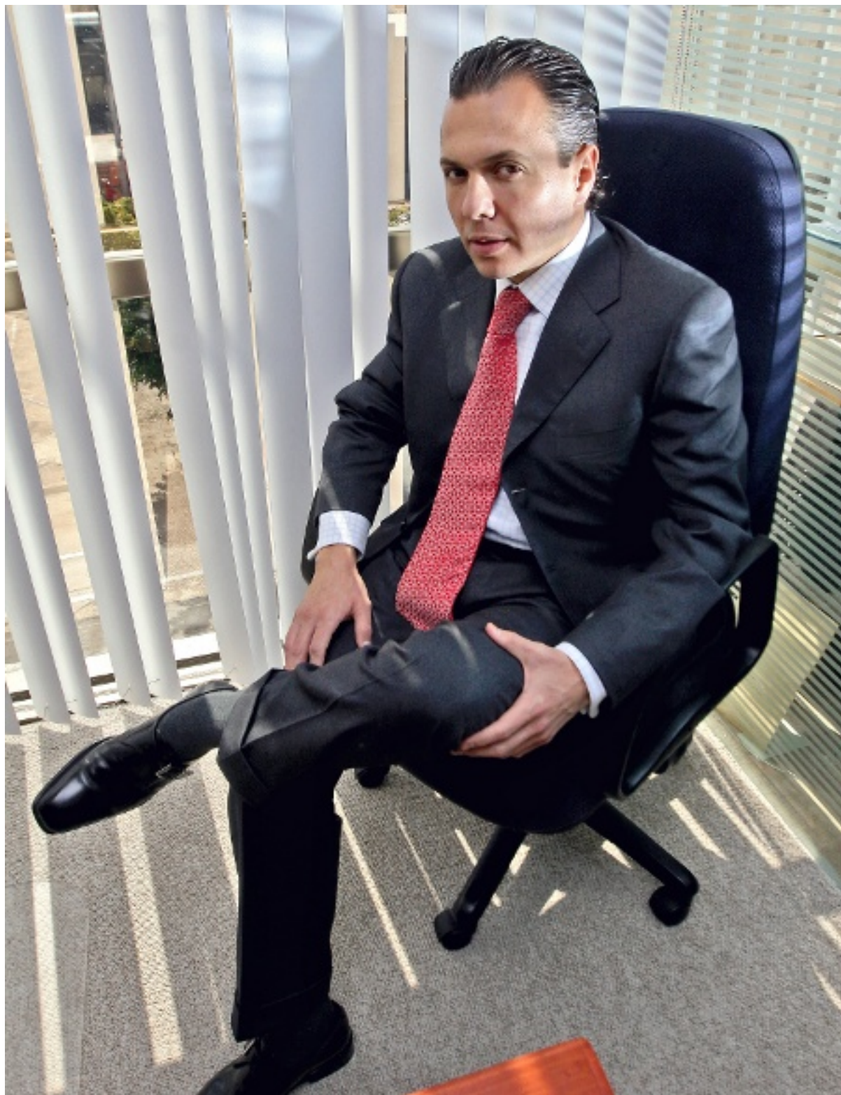
► Pablo Lemus Navarro considera que el compromiso de los patrones con los trabajadores debe ser dar capacitación, seguridad, empleos mejor remunerados, reinversión de utilidades y crecimiento dentro de la empresa.

Yo creo que debe de haber seguridad para el trabajador y el empleador, flexibilidad en la contratación y poder buscar formas de empleo más ligadas a la productividad y los resultados.